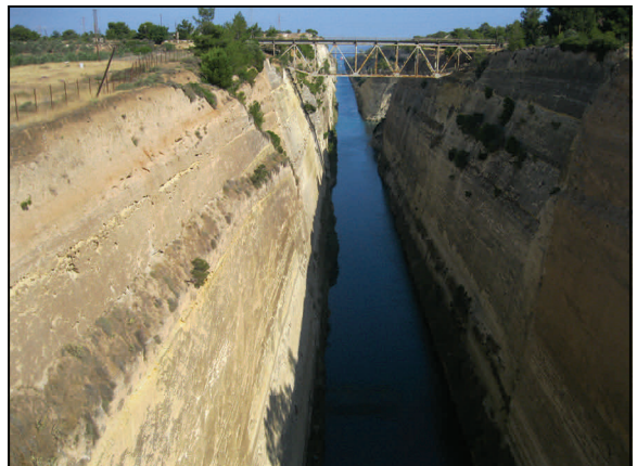
Canal de Corinthe

Le 5ème jour. Départ pour Patras , visite de la cathédrale St Andréa, passage du golfe de Corinthe par le pont Rio. Arrêt à Parga , petite station balnéaire, puis route par la région de l' Epire jusqu'à Igouménista . Ensuite traversée en ferry pour rejoindre la plus belle des îles ioniennes Corfou (1h20 de traversée).